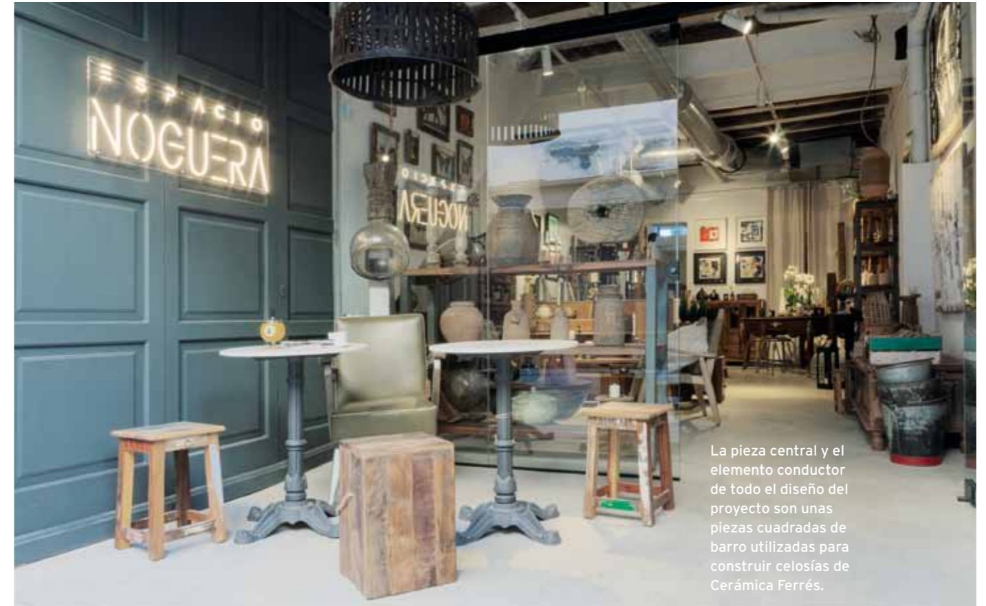
La pieza central y el elemento conductor de todo el diseño del proyecto son unas piezas cuadradas de barro utilizadas para construir celosías de Cerámica Ferrés.