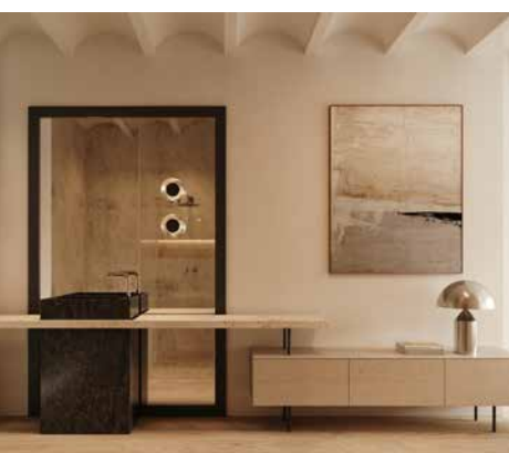
Suite con Baño Abierto Suite with Open Bathroom

What I liked most was that the client gave me carte blanche to design the project. They even encouraged me to design unconventional spaces, which is not common with clients. Also, since it was the home of an artist, sculptor and painter, it had an added value for me because, as I mentioned, I also paint and am passionate about art in general.