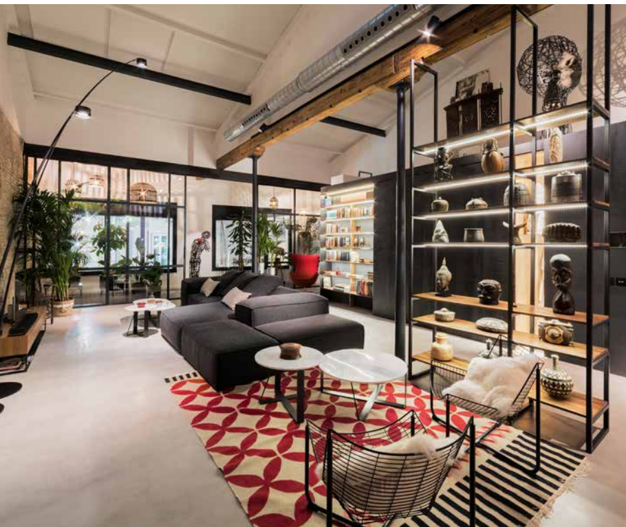
German Design Award Special 2023 / Architecture Masterprize Best of Best 2023