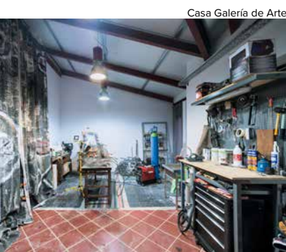
Casa Galería de Arte

“Mi lugar favorito en Panamá es perderme entre las callejuelas de su Casco Antiguo, admirando la arquitectura de las fachadas de sus casas, los diseños de las forjas de las barandillas, los balcones de madera, los colores, y como no también su skyline de noche tomando un refresco desde una de las azoteas de sus altos edificios”.