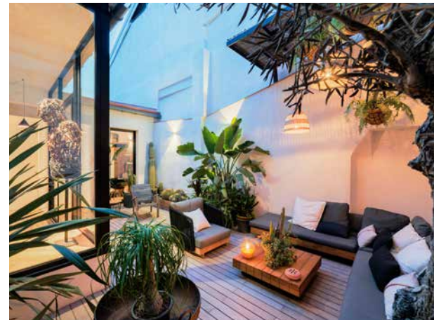
Ida Design Awards Official Selection 2022 / Archilovers Best Project 2022 / SBID Intl. Design Awards - Overall Winner 2022